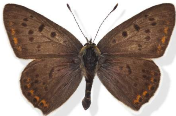
Sort ildfugl - han