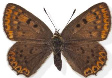
Sort ildfugl - hun