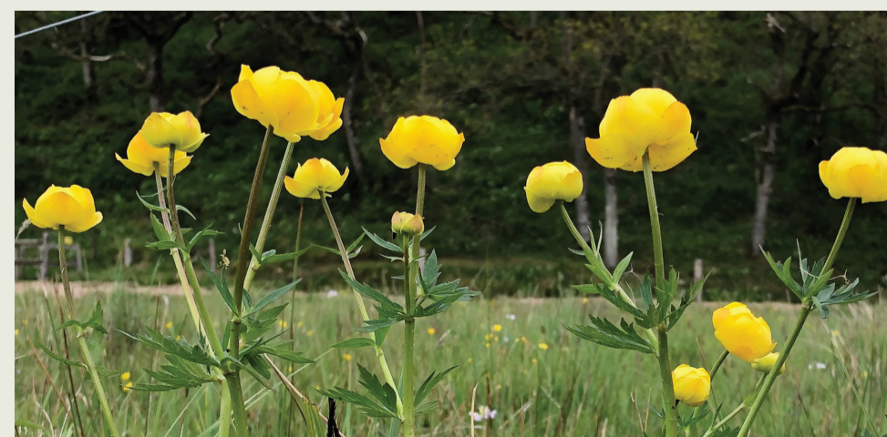
Engblommer i Jordbro Ådal

Nyd de smukke gule blomster - men lad endelig være med at plukke dem. Naturstien er en del af "Sporet ved Smollerup Kirke" og "Kalk Kaminoen" - se mere på spor.dk .